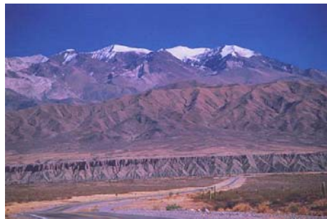
Stimmunen in Patagonien

Tag 5 Sieben Seen Fahrt ! Unser heutiges Ziel heisst San Carlos de Bariloche. Von den Einheimischen nur Bariloche genannt. Wir fahren durch dunkle Nadelwaelder, in denen die Sonnenstrahlen ihr maerchenhaftes Lichtspiel treiben, fahren vorbei an Bergwiesen, wo Quellen munter talwaerts sprudeln, und besuchen auf dieser Fahrt insgesamt sieben Seen. Einer idyllischer als der andere, alle mit kristallklarem Wasser in voellig unberuehrter Natur gelegen. Auf unseren Wanderungen die heute gut und gerne drei Stunden betragen, koennen Sie sich von der Schoenheit der Natur ueberzeugen. Nachdem wir in Bariloche unser gemuetliches Hotel bezogen haben, ist noch genuegend Zeit um die Stadt zu erforschen.