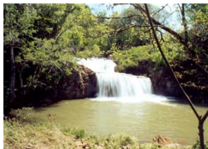
Nat. Park Los Alerces