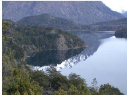
Die 7 Seen Fahrt