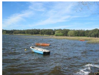
Mar del Plata