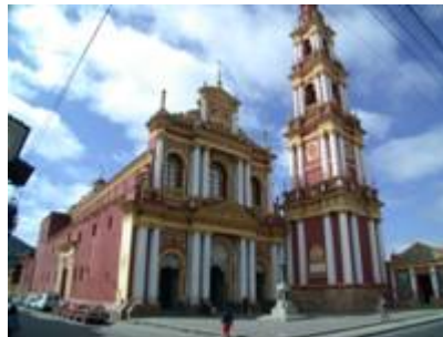
DIE KIRCHE VON SALTA