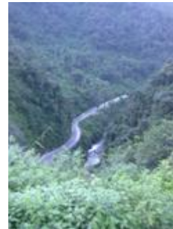
PROVINZ VON SALTA