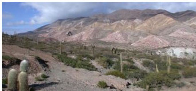
IN DER PROVINZ VON SALTA