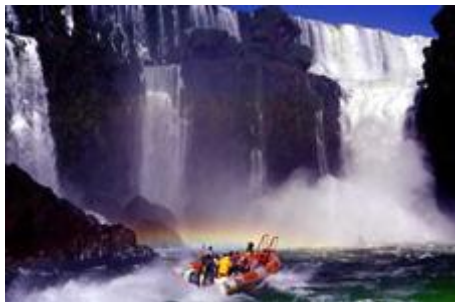
WASSERFAELLE VON IGUAZU