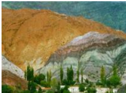
DER BERG DER 7 FARBEN

Tag 22 Buenos Aires - Abflug nach Europa Tag 23 Ankunft zu Hause