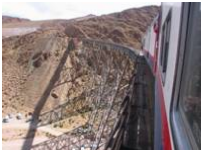
DER ZUG IN DIE WOLKEN