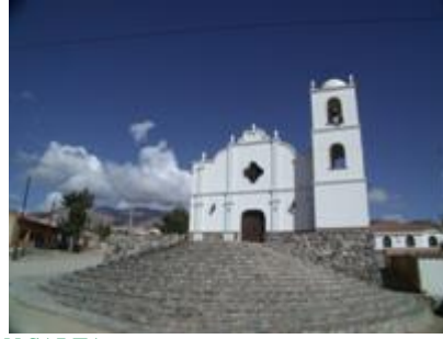
PROVINZ VON SALTA